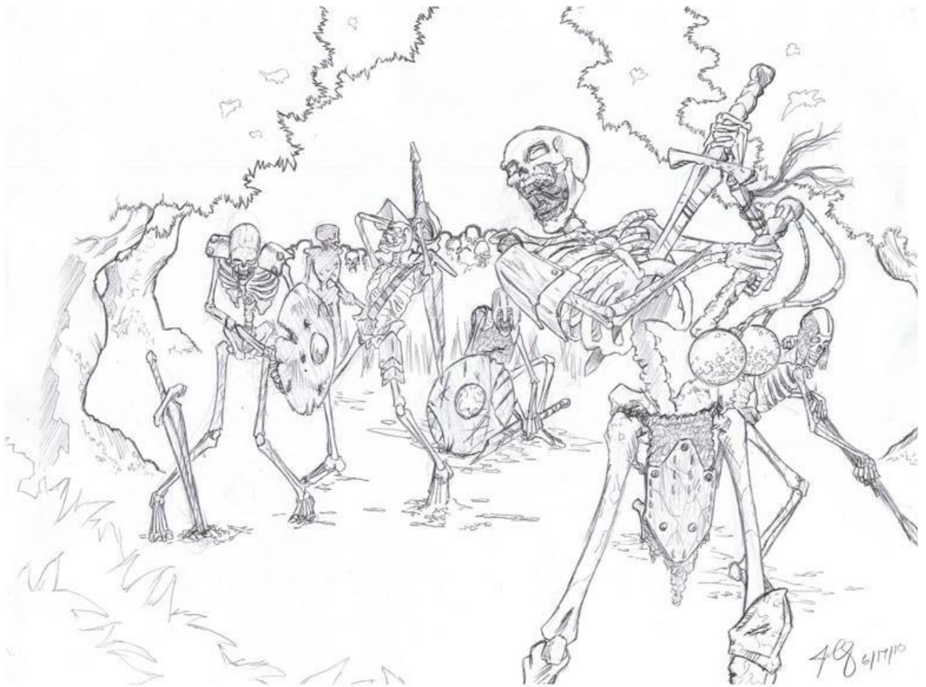
11 La horde de Squelettes se précipite vers vous.

Vous vous redressez et vous avancez péniblement enfoncé jusqu'aux genoux parmi les restes osseux des Guerriers Squelettes vers la tombe sur laquelle Lucius Le Sanguinaire se tenait. À proximité, vous trouvez un sac à dos qui devait lui appartenir. Parmi les parchemins et les notes vous trouvez une Potion de Guérison que vous buvez immédiatement. (Lancez 3 dés et ajoutez le total à votre score d'ENDURANCE.) Vous ne trouvez rien d'autre d'intéressant dans la clairière et vous vous approchez de la grande tombe de Morbius Kane, le sorcier mort-vivant, dans la ferme intention de lui ravir sa légendaire Faux. Rendez-vous au 31